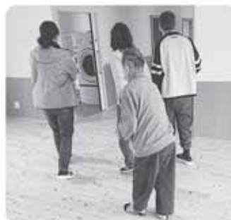
明るくて広いなあ！

今後は毎月仲間の会を開き、どのホームに住みたいか、新しいホームで何をしたいかなど、暮らしの場面で仲間たちの「願い」を育てていきたいと思っています。 年末には、すでに改修が済んでいる部分を仲間と職員で見学に行きました。きれいな居室などを見て「きれいや」「広くていいね」「いつ入れるの？」と待ち遠しそうな言葉が聞かれています。明るい陽射しや木のおいなど、身体全体で温もりを感じられるホームだと思いました。