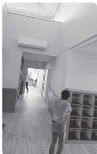
新しくいいホームだね！！