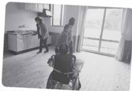
大きい窓、僕の好きな車がよく見えるかな？

仲間たちに、何故工事をしているのか、新ユニットホームが完成後はどこで生活するのかを伝えるため、12月5日に「ユニット仲間の会」が行われました。仲間の会では、仲間たちにイメージが付きやすいようにプロジェクターを使って説明を行いました。「いつから住めるの？」「いつ引っ越しするの？」などと少しわくわくした様子の仲間もいれば、逆に不安そうな表情を浮かべる仲間もいました。