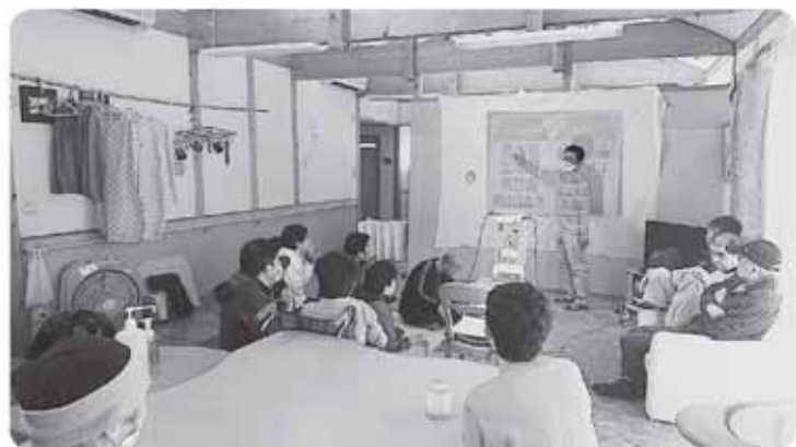
「ユニット仲間の会」