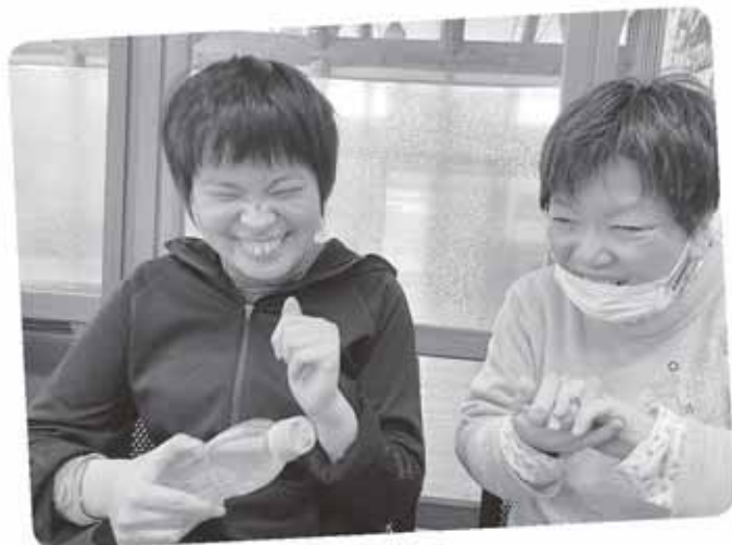
節子さんと一緒に