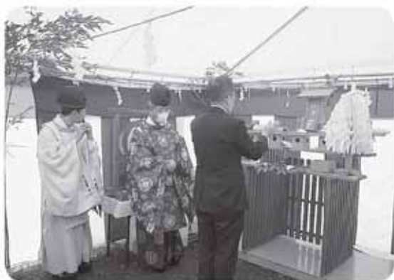
昨年の12月8日（火）に保健・文化交流センターの地鎮祭が行われました。